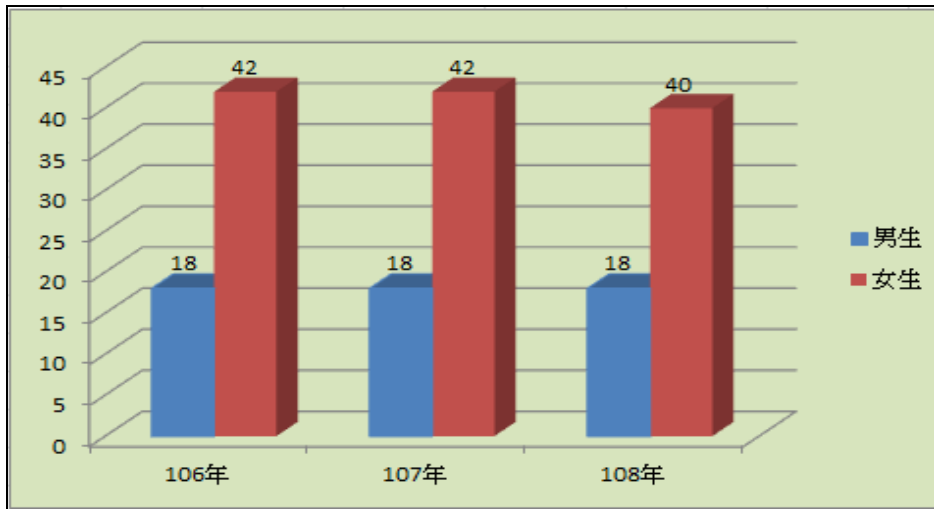
圖一：106-108 年度本府生態保育志工隊男女數量直條圖