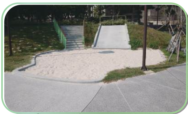
磨石子溜滑梯與沙坑